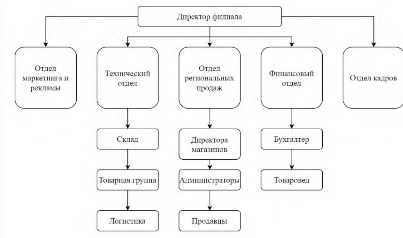
Схема Организационная структура организации ООО «Мир»